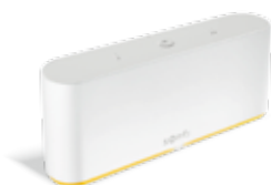
Smart-Home-Zentrale TaHoma® Switch

Wenn Sie sich für ein voll ausgerüstetes Smart Home entscheiden, vernetzt die Smart-Home-Zentrale TaHoma® Switch von Somfy Ihre bereits installierten Funk-Anwendungen. Damit können Sie Ihren Innen- und Außensonnenschutz sowie Ihre Terrassenprodukte per Smartphone automatisch steuern und programmieren.