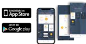
Smart-Home-App TaHoma® App